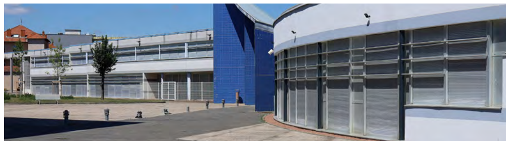
Crèche, Maternelle, Ecole, Lycée, Université : Plan Particulier de Mise en Sûreté